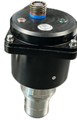
Kablosuz Tapa Programlayıcı